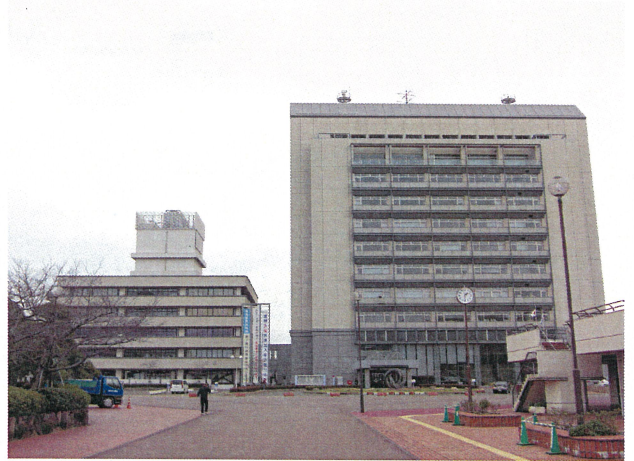
加古川市役所外観 (向かって右手の新館に教育委員会があります)

「今年度導入したのは、小学校が9校、中学校が2校、特別支援学校が1校ですが、来年度は他の市立学校も購入する可能性はあります。と言うのも、先生同士の情報交換が活発で、このような経費節約ソリューションは、口コミでその評判が広まるようですよ。」