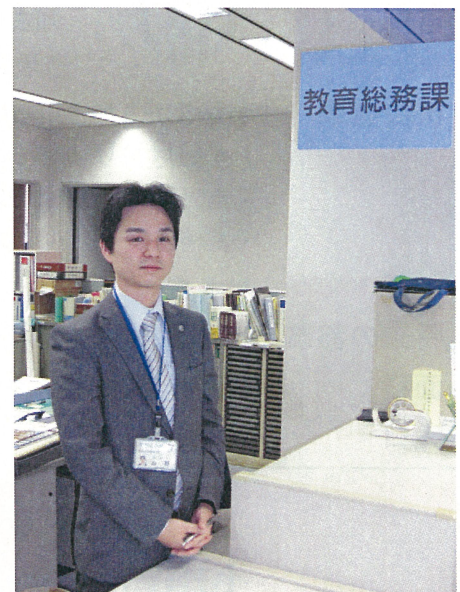
加古川市 教育委員会 教育総務部 教育総務課 山野係長

「各学校とも評価版を試用して、削減効果を確認してから購入希望を出していましたね。評価版が用意されていたのは、実に良かったです。」